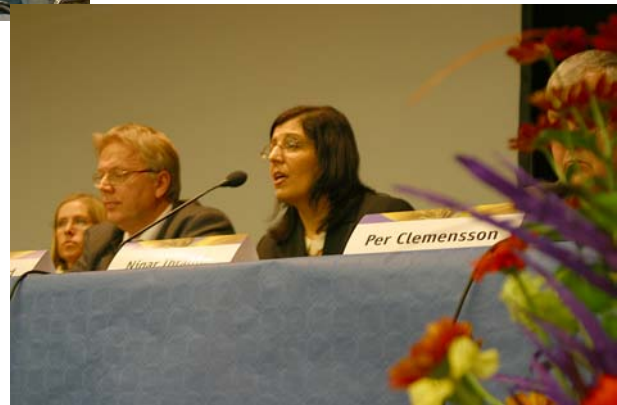
Bilden längst upp: Åhörarna sitter och väntar på att nästa seminarium ska börja.