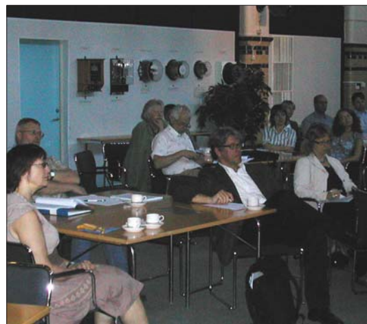
Ett 30-tal personer kom till partnerskapsseminariet.