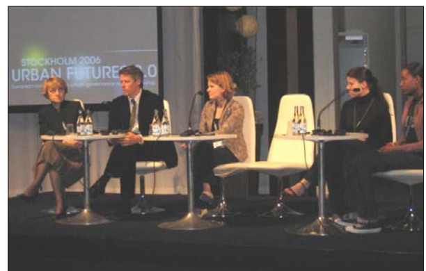
EU-kommissionär Danuta Hübner och integrationsminister Jens Orback diskuterade framtida urbana utmaningar på konferensen Urban Futures 2.0 i Stockholm den 5 maj.

Den 3 - 5 maj arrangerade Stockholms Stad, EU-kommissionen och Regeringskansliet en konferens på temat framtida urbana utmaningar. Konferensen lockade deltagare från hela Europa. Urban II Göteborg deltog med en workshop som behandlade frågan om partnerskapet på projektnivå.