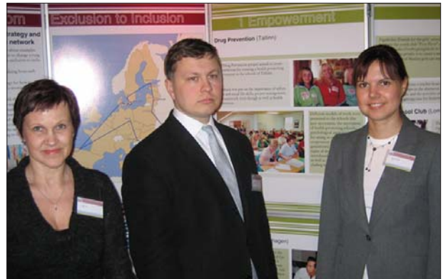
Deltagare från Litauen på Urbactkonferensen i Malmö den 19 - 20 april.

Inom ramen för URBAN II har EU-kommissionen lanserat ett program som syftar till att ta tillvara och sprida de erfarenheter som genereras i de städer som omfattas eller har omfattats av Urban-initiativen. Detta program kallas URBACT. Göteborg har deltagit i ett URBACT-nätverk på temat "Young people - from exclusion to inclusion". Den 19 - 20 april var det dags för slutkonferens. Då presenterades bl a nätverkets forskningsrapport baserad på 35 goda exempel från 12 europeiska städer. För mer information, gå in på länken www.urbact.org eller kontakta Susan Runsten.