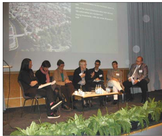
Dialogkonferensen den 19-20 oktober i Göteborg. Paneldiskussion med representanter från de besökande städerna.

Syftet med konferensen var att utbyta erfarenheter städerna emellan samt att diskutera strategiska urbana frågor för framtiden. EU-kommissionen deltog också i sammankomsten. Konferensen lockade 130 personer. Läs mer om konferensen på nästa sida.