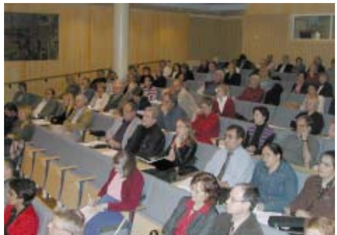
Bilden är från septembers partnerskapsmöte.

I mindre grupper diskuterades sedan pågående satsningar och nya projektideer.