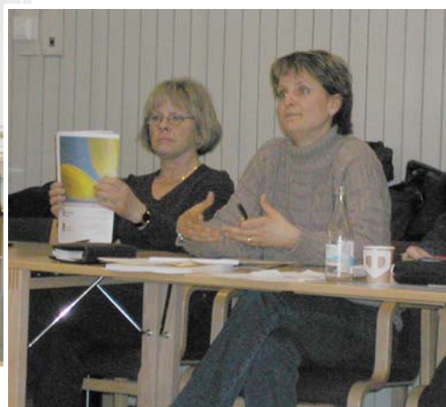
Bilder från det senaste informationsmötet i april i år.