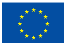
Europeiska unionens strukturfonder